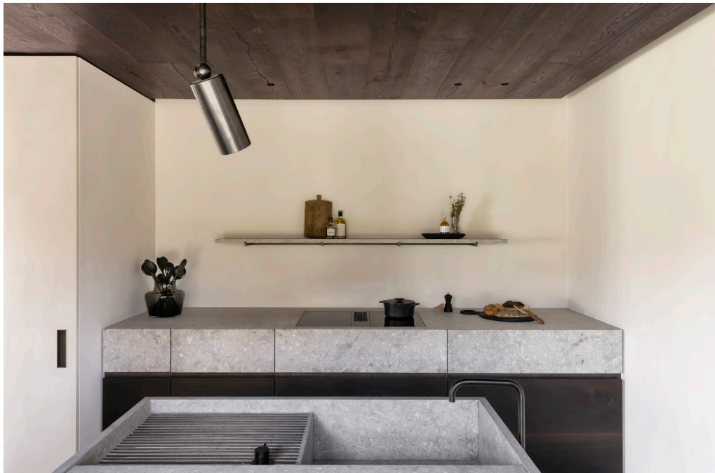
Boven De badkamer wordt afgescheiden door stalen deuren met figuurglas, gemaakt door FreConcept. Onder en rechts Het donkere hout op het plafond, de flagstonevloer en het kalksteen van het aanrechtblad vormen samen een brute mix van materialen, die toch nergens hard aanvoelt. Ingelijste foto van The Douglas Brothers.