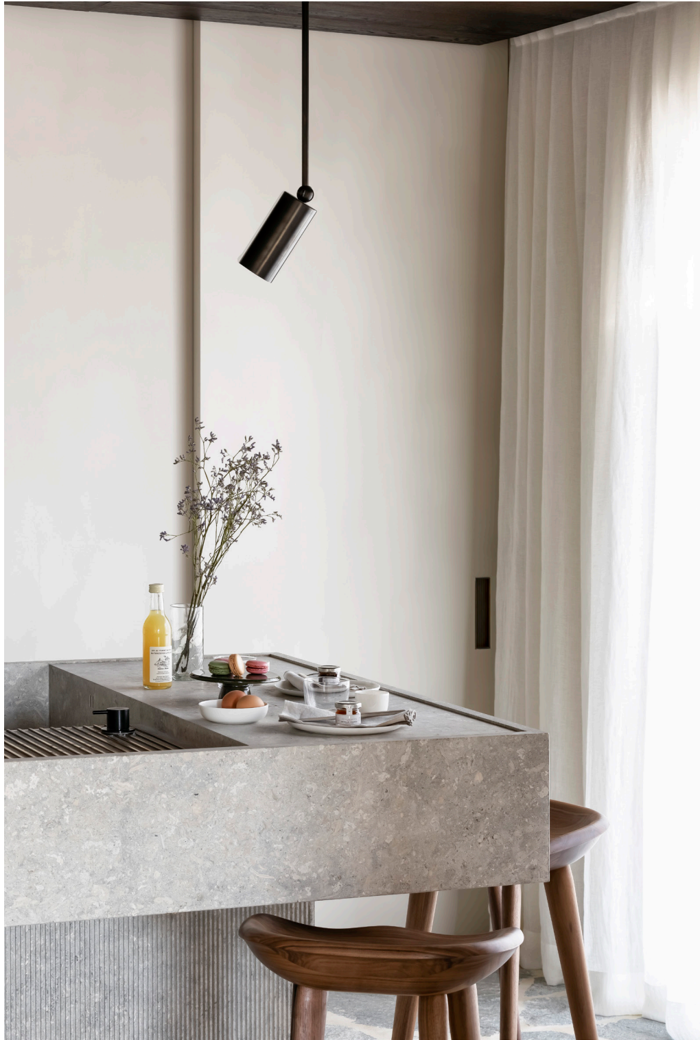
Links De op maat gemaakte wandkast is de uitstalplek voor mooie boeken, kunst en souvenirs. De lamp is van Kalmar Werkstätten. Rechts De keuken is gemaakt van Grigio Alpi, een grijze, fluweelzachte kalksteen. Hanglamp van Apparatus, barkrukken van BassamFellows.