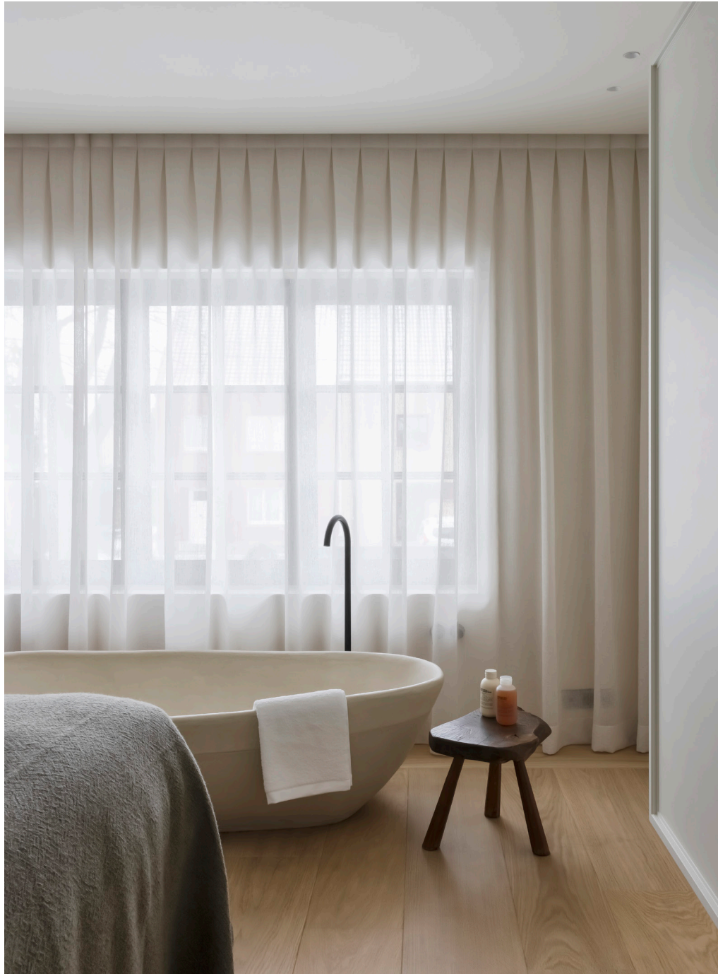
Het vrijstaande bad in de slaapkamer is van het Belgische Studio LoHo, met een kraan van Vola.